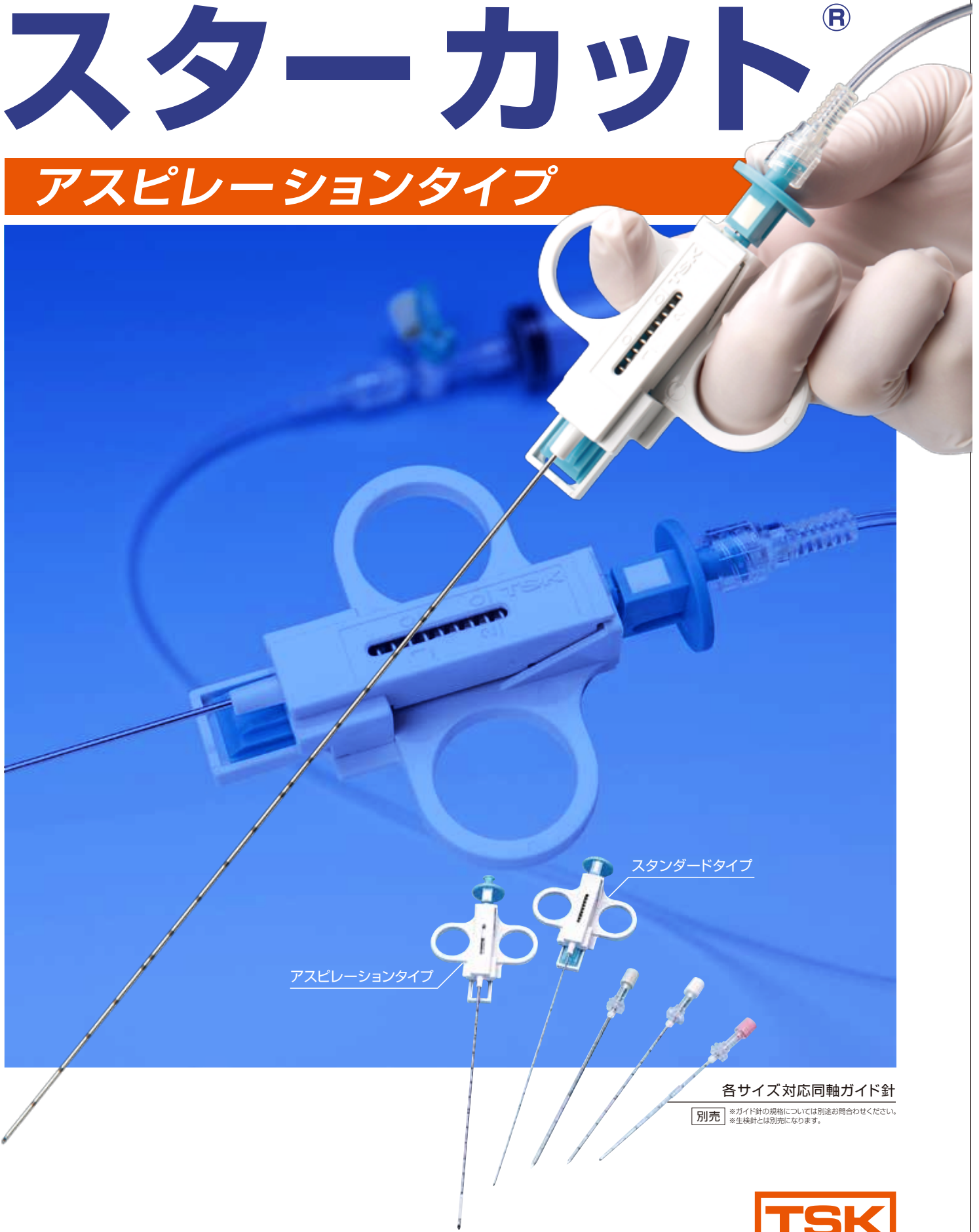
スタンダードタイプ